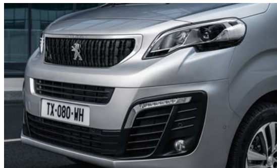
Afgebeeld is Pack Look 2 met 17inch Lichtmetalen velgen

Geen scheidingswand achter de voorstoelen